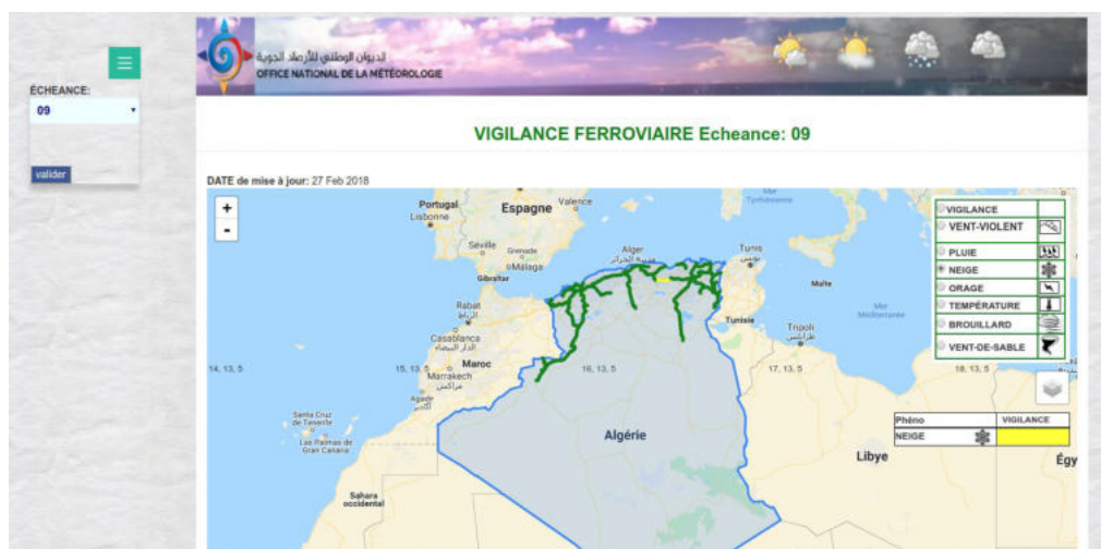
Carte 2 : Capture d'écran de l'interface web destinée à l'affichage de la carte de vigilance du réseau ferré national (phénomène neige).