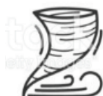
Vent de sable