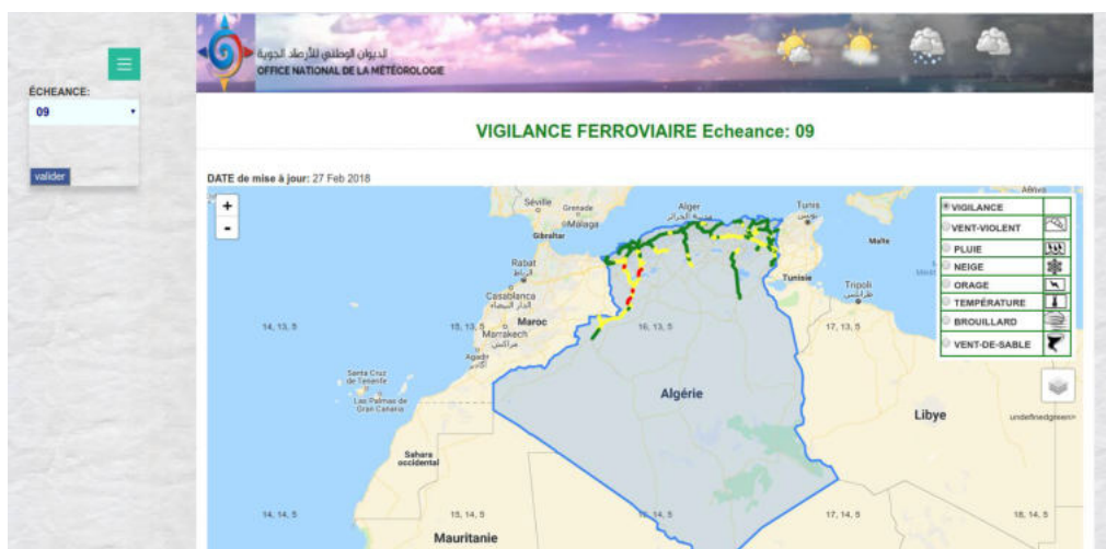
Carte 1 : Capture d'écran de l'interface web destinée à l'affichage de la carte de vigilance du réseau ferré national (tous phénomènes confondus).